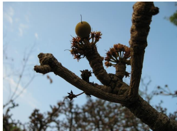
Fleurs et noix de karité

Les noix de karité sont beaucoup chaque année au Bénin. Ses noix sont utiles pour la fabrication du beurre de karité. Concernant les autres plantes comme l'iroko, le caillcédrot et la cassia les guérisseurs utilisent les feuilles, les racines, les tiges et écorces pour la