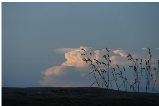
Va, mon âme à l'espoir immense !

Nous voudrions par ce dernier paragraphe inviter les parents à vivre en fonction d'un budget familiale et les élèves à penser à viser loin.