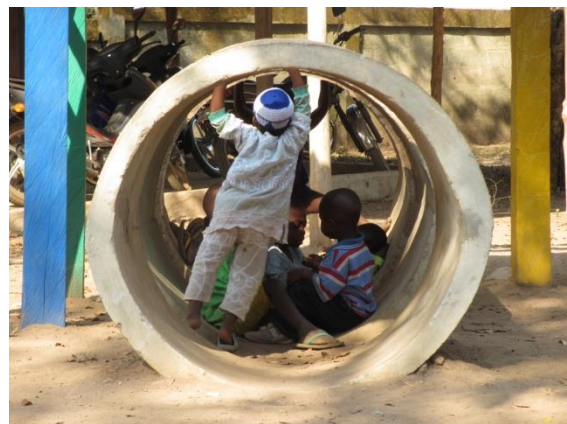
Le droit à jouer, à discuter ensemble, à manger

Cette journée est célébrée pour que les adultes se rappellent que chaque enfant mis au monde est un être qui a le droit à sa vie.