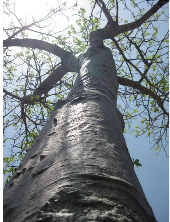
Baobab, arbre de la vie