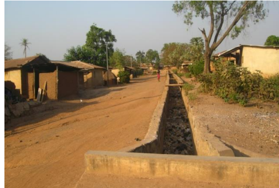
Sur le pont d'Issalè qui mène à AYEKE. On voit les ordures jetés dans le cas niveau. Ils vont aller où ?

Changeons notre attitude maintenant pour un mieux être demain!