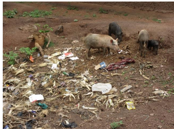
Un endroit à Koko

La pollution est l'action de polluer c'est-à-dire de rendre impropre et insalubre l'environnement. Ainsi avons-nous les ordures ménagères, les cadavres des animaux, la déforestation, les feux de végétation, l'utilisation des produits chimiques rendant insalubre notre environnement.