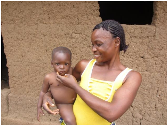
Eduque et aime ton enfant !