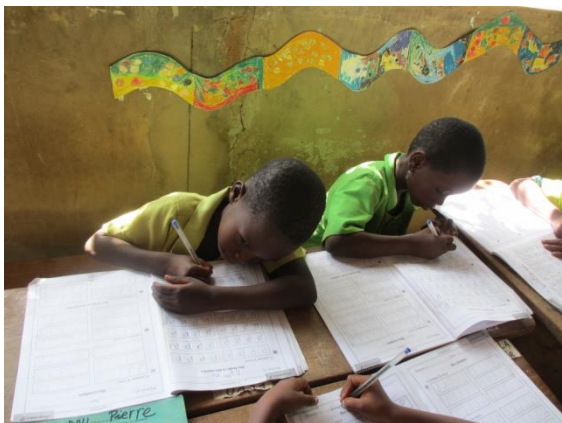
Au CI on met la base de l'éducation scolaire.

A côté de l'instruction des matières, l'élève reçoit une éducation démocratique pour devenir un citoyen responsable.