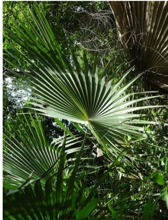
Le beau vert du rônier

En somme, le déboisement est une mauvaise pratique qui mine le développement des espèces animales et végétales. Par conséquent, nous devons lutter contre le déboisement et agir pour une bonne gestion des ressources forestières. Il est conseillé à chacun de nous de planter les arbres après en avoir coupés.