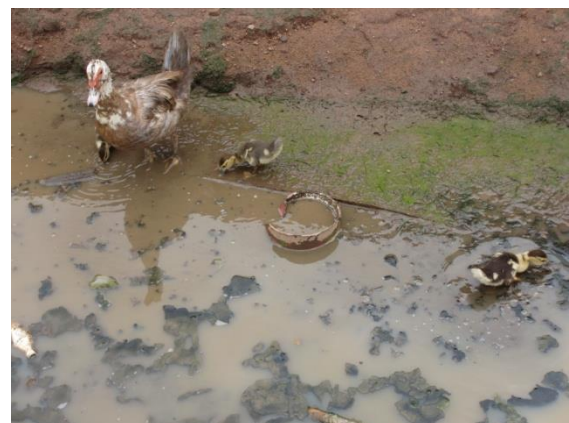
L'eau de douche est polluée

Nous devons apprendre de ne pas verser les eaux sales n'importe où et n'importe comment. Aussi sont les lieux de douches souvent des lieux d'habitations de moustiques qui sont porteurs du paludisme.