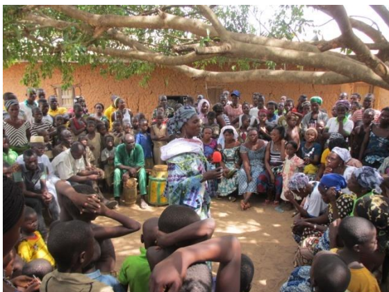
La fête de la femme à Koko