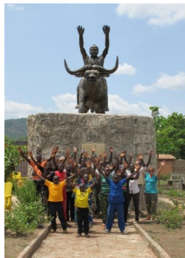
Savalou, place SOHA

Après le petit déjeuner nous sommes partis du CPN pour aller rencontrer les apiculteurs de Moudja, un village sur la piste vers Dassa. Ils nous attendaient dans leur miellerie. Le groupe apicole utilise les ruches kenyanes. L'environnement n'est pas propice pour l'apiculture car il n'y a pas de fleurs mellifères pour les abeilles: pas d'arbres, pas de brousse. C'est la raison pourquoi les apiculteurs ne peuvent pas gagner de l'argent avec du miel à côté des champs. Les élèves d'Ayéké et du collège ont conseillé les apiculteurs de faire une sensibilisation des populations pour des pépinières et à un arrêt des feux de brousse. Les jeunes apiculteurs des écoles de Koko ont compris dans cet échange qu'ils ont déjà appris beaucoup de choses pendant les années qu'ils participent au club apicole.