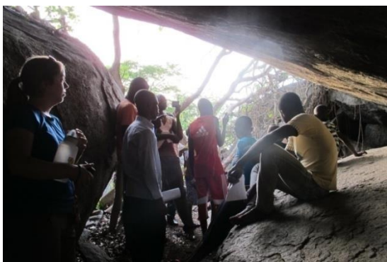
L'endroit de l'ancien palais royal

Les élèves d'Ayéké et du collège qui fréquentent le club «apiculture» ont fait une excursion les 29 et 30 mars au CPN les papillons à Kamaté-Shakaloké dans la commune de Dassa Zoumè. Nous sommes reçus par les responsables du CPN. Un éco-guide est venu pour nous conduire. Le circuit choisi est la randonnée pédestre sur une des collines. Après plusieurs mètres de marche, le triste constat observé est que le feu de brousse est passé et que les gens viennent couper les derniers gros arbres pour en faire du charbon en haut de la colline. Nous avons rencontré des petits champs sur des espaces vides entre des rochers. Entre deux grandes et hautes roches bien proches, le guide nous a montré une place propre où dans l'ancien temps se trouvait le palais royal.