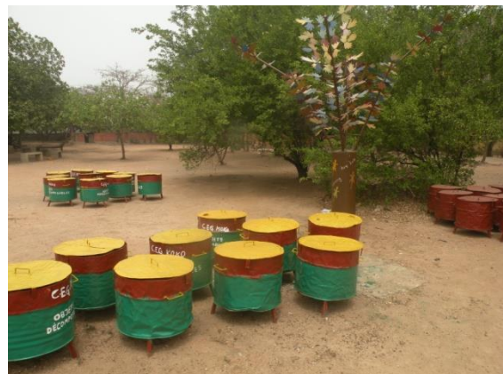
Les poubelles pour le CEG-Koko

Entre temps il n'y avait pas des poubelles au CEG-KOKO. Les tas d'ordures sont jetés par ici et par là. Des fois, ils sont même laissés dans la cour de l'établissement par certains élèves. Le collège était sale.