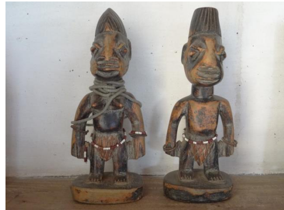
Igbédji – les jumeaux

La culture de ma localité relève surtout des pratiques sociales. Ainsi on note : La dot avant un mariage, la solidarité, le respect des aînés et surtout des belles familles.