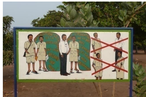
Est-ce que vous connaissez cette affiche ?

Cette pratique en milieu scolaire est pleine de conséquences fâcheuses sur l'avenir des élèves. Filles et garçons.