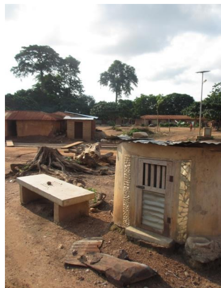
La forêt sacrée d'Abouloussi surveille Koko

Abouloussi nr. 4 en 2011 avait le thème de l'évolution.