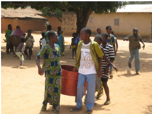
Les élèves d'Ayékè partagent les poubelles

Gardons notre environnement propre pour la santé de tous.