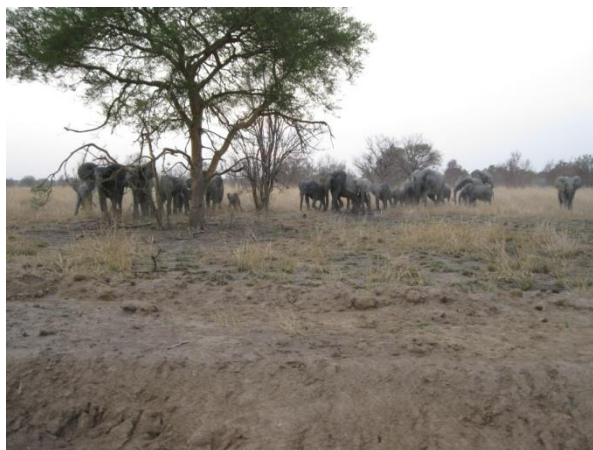
Nous avons rencontré un troupeau d'éléphants qui a traversé la piste devant nous.

des guibs harnachés, des vautours et des pintades. Sur le mirador de la mare sacrée nous avons vu des hippopotames, deux buffles, des crocodiles, un troupeau de trente éléphants et un troupeau de buffles. Les hippopotames restent pendant la journée dans l'eau et respirent dans l'eau comme un bœuf hurle. Nous avons passé la nuit dans la résidence des forestiers au niveau de la plaque: PORGA ARLI BATIA.