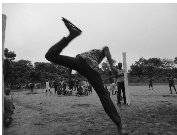
Rien ne protège les pieds après le saut en hauteur

Ce qui m'a choqué en voyant les images était le saut en hauteur pendant la journée sportive. Après le saut, les élèves atterrissent sur le sol où il y a des cailloux, de la latérite et de la saleté.