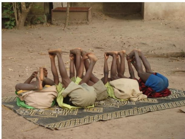
Les élèves marchent pieds nus

Quand les bébés naissent, ils sont de teint clair. C'est avec le temps qu'ils noircissent. Les élèves ne connaissent pas la mer. Les gens sont heureux malgré qu'ils aient moins de choses que nous. Dans la nuit, ils dorment dehors sur de fines nattes et non pas dans la maison sur des lits. Les enfants marchent pieds nus.