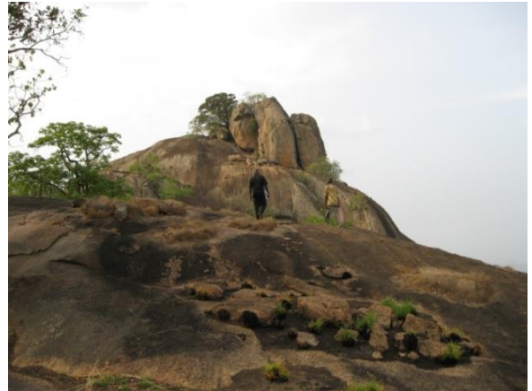
Soubakpèrou, la montagne la plus haute du Bénin

Beaucoup de jeunes aujourd'hui cherchent obtenir le baccalauréat. Quand on leurs a demandé la raison, ils ont répondu :