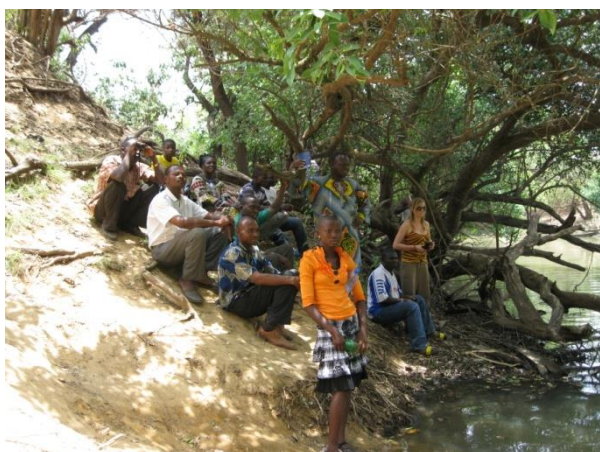
Nous sommes assis à l'ombre au bord du fleuve Pendjari et observons les pêcheurs burkinabais.

Nous nous sommes arrêtés au fleuve Pendjari qui fait la frontière entre le Bénin et le Burkina Faso pour le traverser par la pirogue des pêcheurs du Burkina.