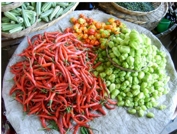
Voici les bons produits naturels de nos champs!

Soyez fiers de votre savoir si riche ! Votre culture et votre tradition vous fait plus libre. Soyez fiers de vos cultivateurs ! Se sont eux qui nous donnent notre alimentation de base chaque jour.