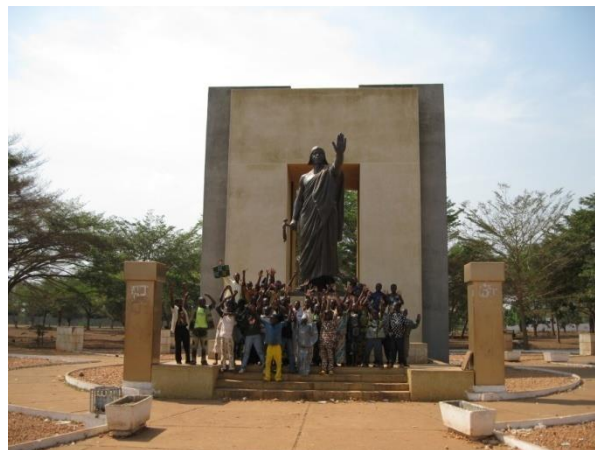
L'excursion du CM2 (2009/2010) à Abomey : ici à la place Goho devant le monument du Roi Béhanzin

Si on plante de l'igname dans la terre sèche et chaque jour on l'exhorte à pousser sans donner de fumier et de l'eau, elle disparaîtra misérablement. Mais si on vérifie chaque jour son état de santé, lui amène de l'eau s'il en manque, sarcle la mauvaise herbe et la protège contre les attaques nuisibles, le tubercule grandira splendidement et nourrira toute une famille ! Exactement de telle manière on devrait traiter ses enfants et ils ne deviendront pas qu'une assurance pour la vieillesse mais des amis et des partenaires avec lesquelles on peut lutter pour un meilleur avenir.