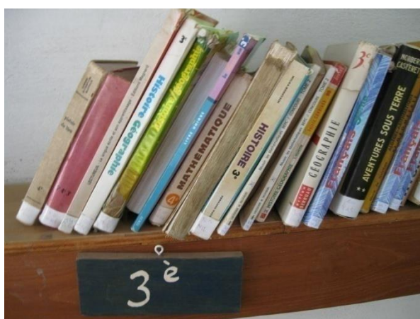
Un des rayons pour les collégiennes et collégiens.

La bibliothèque à Ayékè a commencé à fonctionner le 14 décembre 1999. Elle contient des livres de la maternelle jusqu'en terminale. Sur les étagères vous trouverez aussi des beaux livres de photos, des bandes-dessinées, des livres sur les lois de la route, des livres du Bénin, sur l'art et la culture, l'environnement, la science, la santé, le corps humain, des livres de contes, des romans des écrivains africains, les romans jeunesse, des Atlas, dictionnaires, encyclopédies, des journaux et beaucoup d'autres encore. Il faut venir voir pour regarder tout ce qu'il y a sur les tables et les étagères.