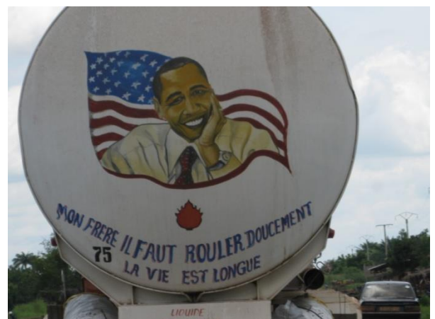
Sur un camion citerne du Niger

Pour cette année où 17 pays africains fêtent 50 ans d'indépendance, le président américain Barack OBAMA a invité des jeunes africaines et africains pour un forum à Washington. Le président américain les conseille de ne pas suivre les pas de la génération précédente, génération des indépendances, qui, selon lui, s'accrochent au pouvoir, alors qu'ils ont tous parlé dans les années 1960 de la démocratie et de l'alternance. « Et ce qui s'est produit, c'est que lorsque vous avez été au pouvoir pendant un certain temps, vous vous dites oui, j'ai été un si bon dirigeant que pour le bien de mon peuple, je dois rester en place ! » Et c'est comme cela que l'on commence à changer les lois, à intimider et à emprisonner des opposants. « Et bientôt de jeunes gens comme vous, pleins d'avenir et de promesses, sont devenus ce qu'ils avaient combattu », a regretté le président Obama.