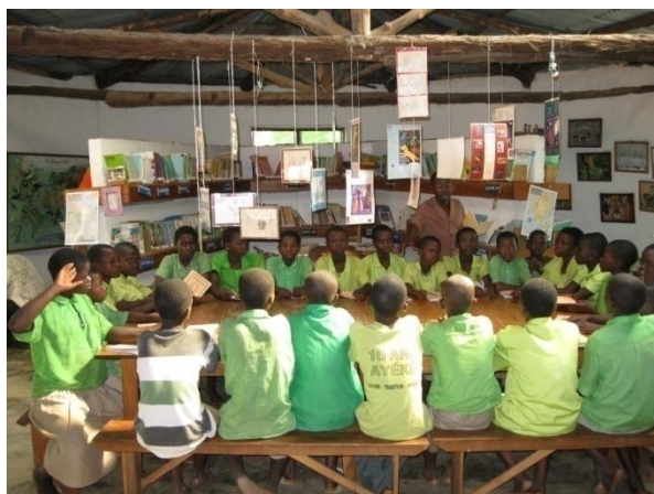
A l'intérieur de la bibliothèque pendant le club de lecture

La bibliothèque à Ayékè a commencé à fonctionner le 14 décembre 1999. Elle contient des livres de la maternelle jusqu'en terminale. Sur les étagères vous trouverez aussi des beaux livres de photos, des bandes-dessinées, des livres sur les lois de la route, des livres du Bénin, sur l'art et la culture, l'environnement, la science, la santé, le corps humain, des livres de contes, des romans des écrivains africains, les romans jeunesse, des Atlas, dictionnaires, encyclopédies, des journaux et beaucoup d'autres encore. Il faut venir voir pour regarder tout ce qu'il y a sur les tables et les étagères.