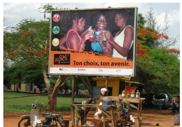
Publicité sur la planification familiale au bord de la route à la place Goho à Abomey

Pendant l'excursion du CM2 d'AYEKE à Abomey, j'observe la même chose. Les élèves chantent, expriment leur joie du voyage et ne regarde pas dehors. Ils n'ont pas l'habitude. Je comprends car à Koko il n'y a pas beaucoup d'affiches ! Mais les temps changent et si les enfants de Koko ne changent pas, ils auront des difficultés dans leur avenir. Encourageons-les alors d'utiliser les yeux pour lire tout ce qu'on trouve !