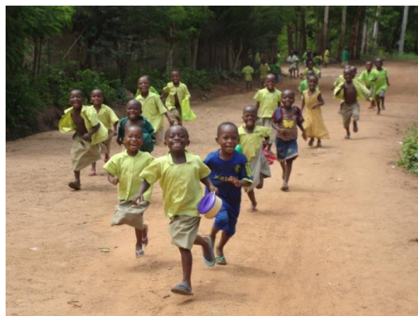
Quelle joie d'être enfant ! Quelle joie de rentrer à la maison ! Quelle joie de revenir à l'école !

Merci chers parents et bonne compréhension !