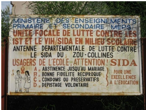
Une affiche au bord de la route

Du magasin SPORE, août 2010, Révérend Symon MSOWOYA