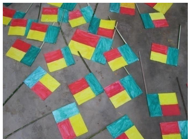
Préparation de la fête du 1 er août 2010 dans le club de dessin à Ayékè