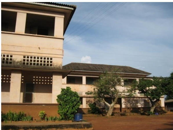
A l'intérieur du lycée Houffon

La vie du collège est différente de celle au primaire. Il y a un professeur par matière. Ils viennent dans notre classe, donnent le cours et repartent. Les professeurs enseignent bien. Une surveillante, un proviseur et un censeur nous dirigent au collège. Les lundis, les professeurs et élèves se regroupent au drapeau du Bénin pour une cérémonie : chanter l'hymne national. Nous avons sept classes au foyer : de la 6 ème à la terminale où on termine avec le baccalauréat. Malheureusement les mois de février et mars, les professeurs ont fait la grève. Mais nous avons quand même essayé de nous regrouper et travailler. Nous avons cours du lundi au vendredi et samedi nous avons les travaux dirigés par un professeur.