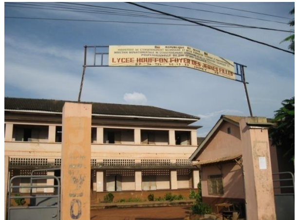
L'entrée du lycée Houffon à Abomey

Des lycéennes parlent (année scolaire 2009/2010)